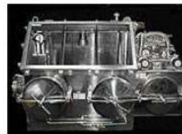
超高真空グローブボックス