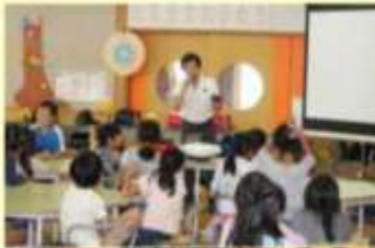
新聞スクラップ教室