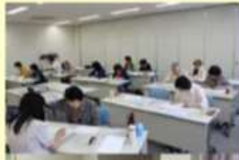
天地人書き写し教室