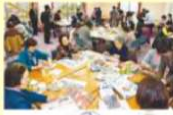
新聞エコバッグ教室