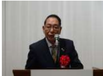
下口ガバナーご挨拶