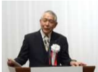
堀江ガバナー補佐ご挨拶