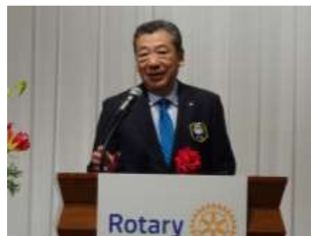
若林ガバナーご挨拶