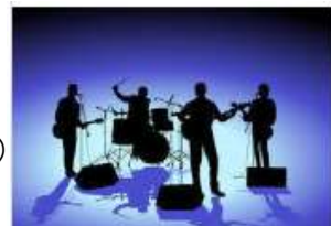
出演、シティーRCバンド