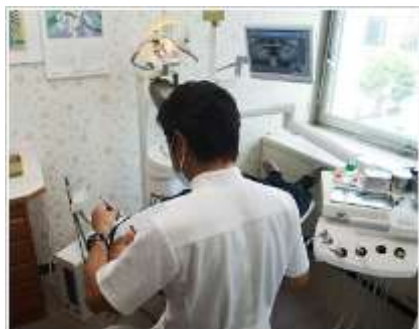
治療室は、全て個室となっております。

最先端技術の高精細画質 先端技術を用いた高画質なCT撮影を、インプラントをはじめ様々な治療に活用します。