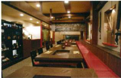
1階いろりコーナー40名様 (可) (飲み物付き¥5,000円から)