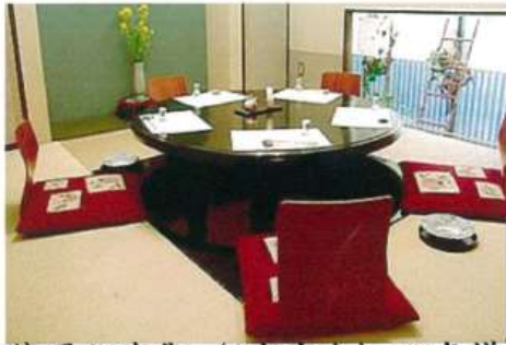
ご接待用お座敷 (6室有り) 20名様 (可)