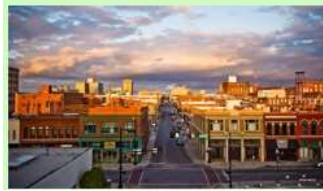
アメリカのミズーリ州