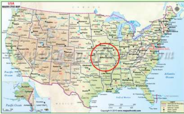
生まれ育ちはアメリカのミズーリ州