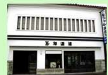
酒造り文化（発酵文化・並行副産物）