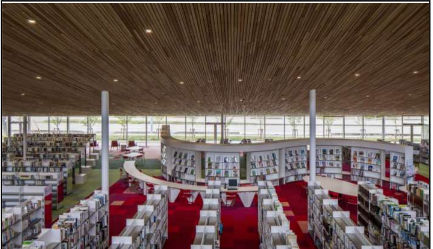
砺波市立図書館 2020年7月竣工