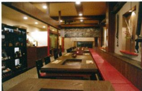
1階いろりコーナー40名様 (可) (飲み物付き¥5,000円から)