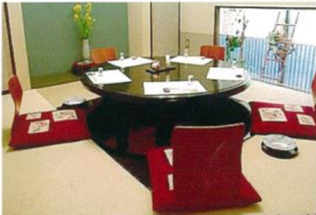
ご接待用お座敷 (6室有り) 20名様 (可)