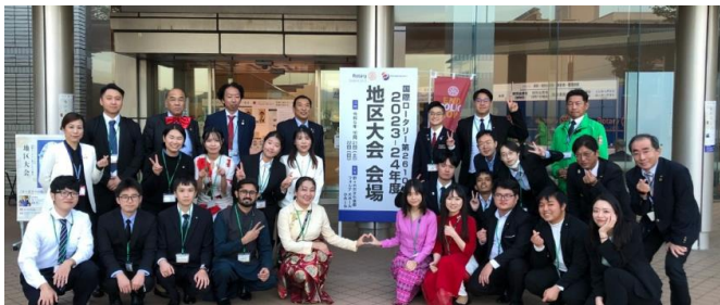
↑米山奨学生の皆さん タムちゃんも参加しました。

とき 令和5年10月22日(日) ところ 野々市市文化会館フォルテ 大懇親会 野々市市立野々市小学校