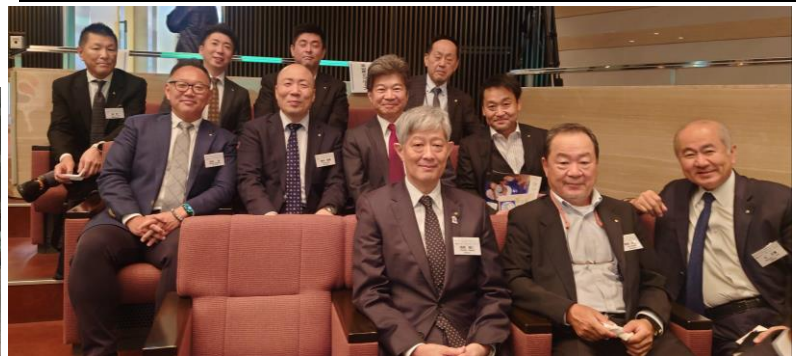
↑地区大会にご参加いただきました皆様、お疲れ様でございました。