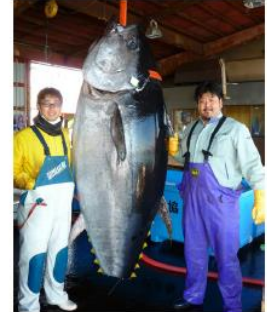
体長約270cm、重量376kgの超大物 (青森県三厩漁港)