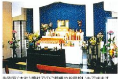
鳥別家(本社) 葬社での「葬儀やお骨上げ」が出来ます