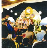
富別家(やすらぎの里)

これからは君のいないさみしい日々……。だけど私達の心の中にはいつだって君がいる。さよならマイルドな思い出をありがとう。時には愛らしい我が子のように、時には心のささとなる友達のような存在のペット達。しかしながら、やがて訪れる別れの時は悔しいながらも送り出したものです。私どもはそういったご家族の想いを胸に、昭和55年に創業いたしました。現在は富山市西尾屋に本社を構え、関東地区の福山市植原に葬儀・供養施設として「やすらぎの里」、関西地区の高岡市戸出に葬儀・供養施設として「思い出の里」を設立しております。また、高岡の金光院においても納骨・供養をし、創業以来皆様からの信頼と数々の実績を誇りに、北陸ペット葬儀社は、小さな魂の供養に誠心誠意努めております。