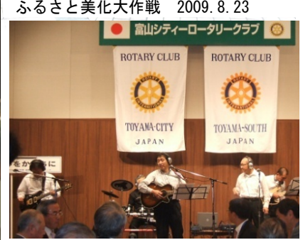
富山南・シティ合同例会 2009. 11. 16.