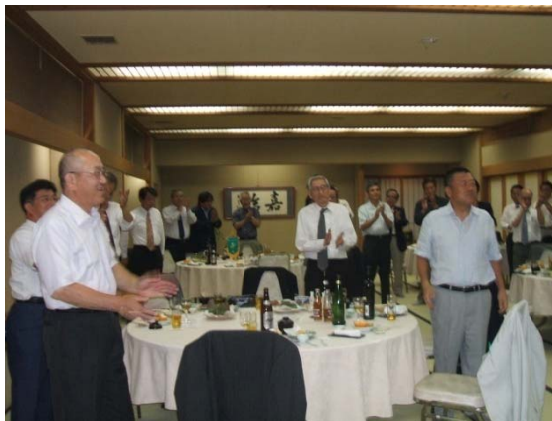
次年度も素晴らしい一年でありますように。