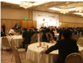
富山7RC合同例会 2010. 2. 24