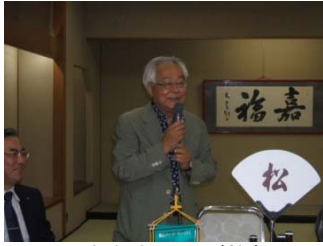
本多会長のご挨拶

とき 平成22年 6月21日(月) 18:30~ ところ 懐石 松や 富山市新富町 1-5-3