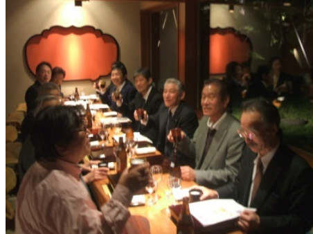
観月会夜間例会/楽翠亭 2009. 10. 19