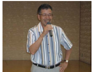
土田会長エレクトの中締め