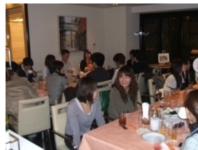
男女出会のパーティ 2010. 3. 5