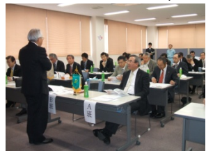
職場訪問例会/ダイト(株) 2010. 3. 8