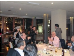
年末忘年夜間例会/雅楽俱 2009. 12. 21