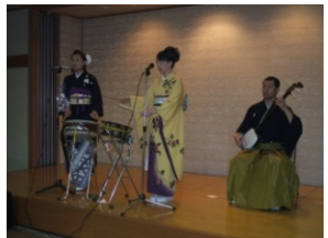
婦南民謡会の皆さん 2010. 1. 25