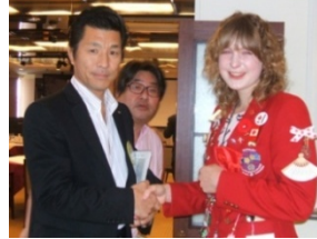
最後の例会「アリガトウ」