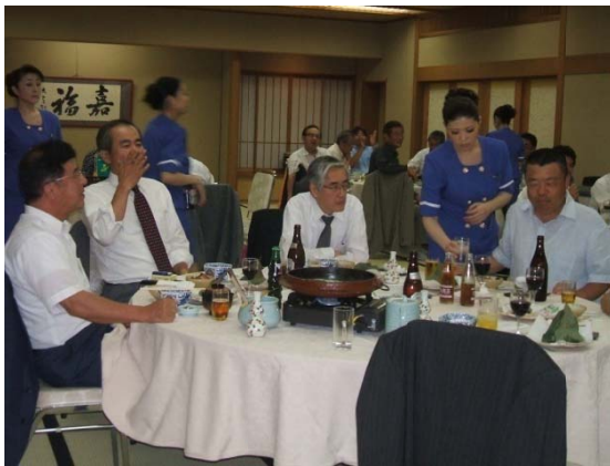
みんなで楽しいひとときを過ごしました。