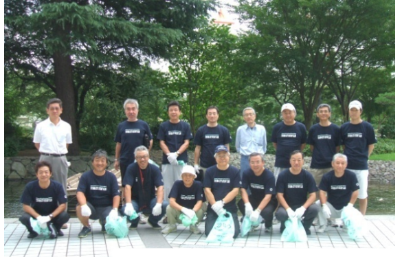
ふるさと美化大作戦 2009. 8. 23