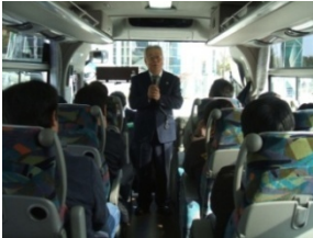
男女出会のバスツアー 2009. 10. 25