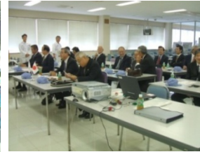
職場訪問例会/田中精密工業 2009. 10. 26