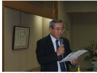
桶屋幹事の幹事報告