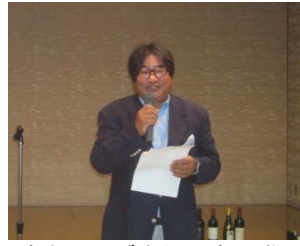
清水クラブ奉仕理事の進行