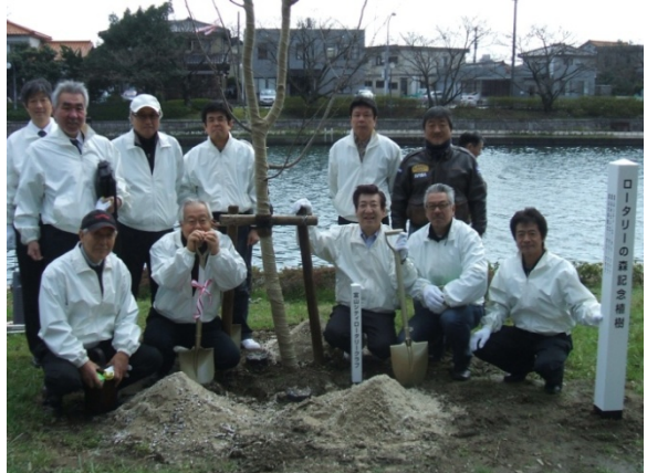
「ロータリーの森」記念植樹