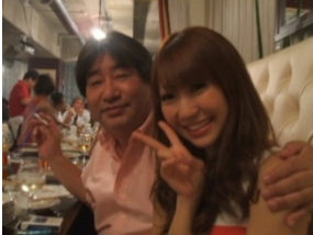
かわいいバドガールとの楽しいビア例会 2009. 9. 14