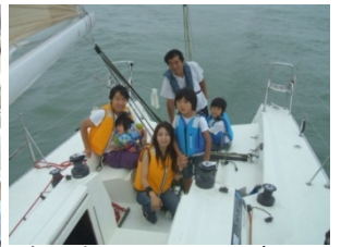
富山湾ヨットクルーズ 2009. 8. 9