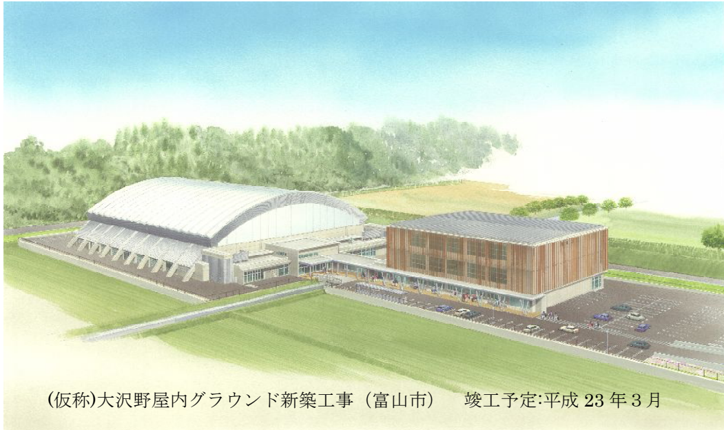
(仮称)大沢野屋内グラウンド新築工事 (富山市) 竣工予定:平成 23 年 3 月